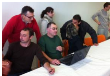
Les résultats sont très serrés....