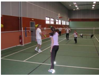
un autre match très joué