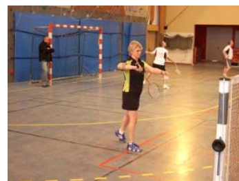
Une bonne concentration...