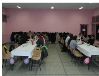
Là c'est du sérieux !