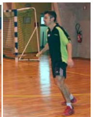
"Ouah quel saut !"