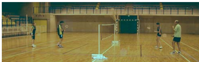
Le match ultime... Belle victoire en 2 sets