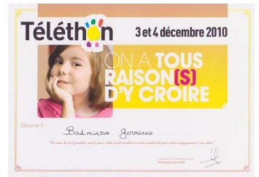
Diplôme remis le samedi 12 février 2011