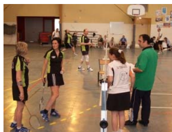
Que se passe-t'il monsieur l'arbitre ?