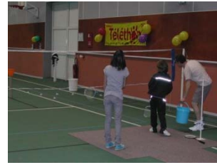
le défi du volant