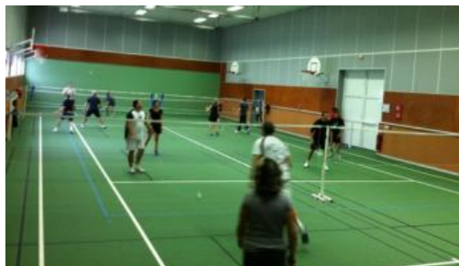
Tellement rapide qu'on ne voit pas le volant !