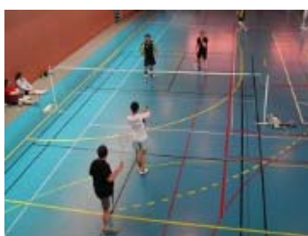
Seb et Ludo face au PLT