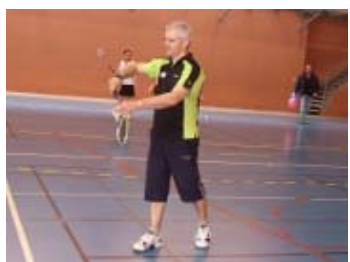
"Alors là je m'applique !"