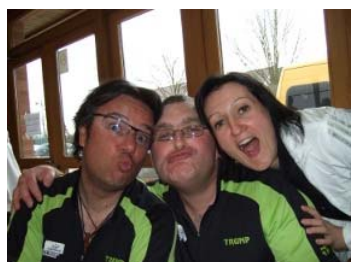
Le podium du concours de grimaces