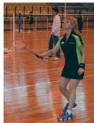
Toujours en éveil