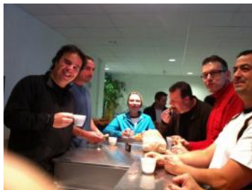
Y en a qui font pas que boire du café !!!