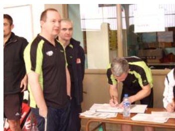
Préparation minutieuse des équipes