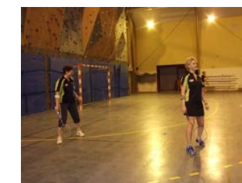
une équipe victorieuse