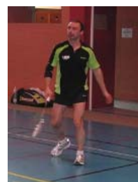
... Dur dur ...

Pour consulter toutes les photos disponibles cliquer ICI