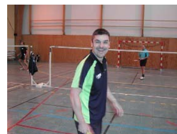
Ben moi j'm'éclate