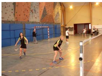
donnent un très beau match