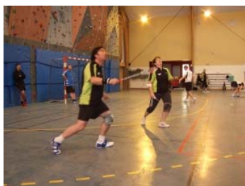
Et c'est parti