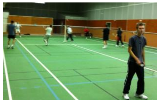
Et c'est parti