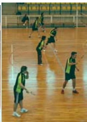
Une grande présence sur les terrains