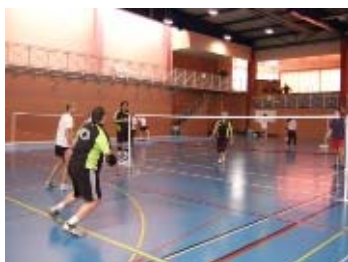
un double hommes particulier