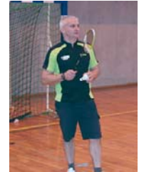
Il abandonne mon adversaire ?