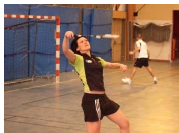
et une bonne souplesse...