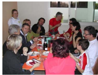
une pause bien méritée