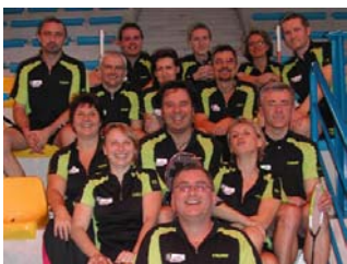
La belle équipe (y'a un intrus qui jouait pas)