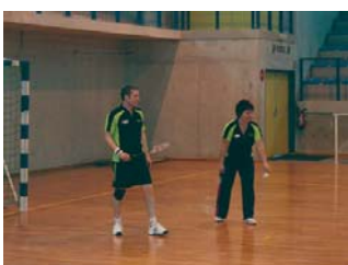
Quelques matchs un peu plus accrochés que d'autres...