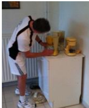
1 café pour commencer

Une bonne ambiance lors des rencontres suivi d'un repas convivial autour d'un casse-croûte mis en commun