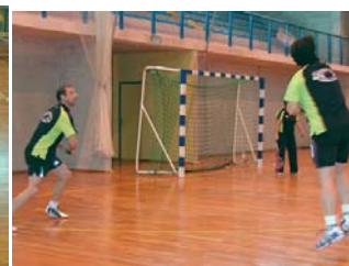
Et hop !