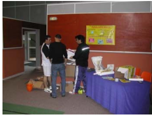
les préparatifs (banderoles, ballons, affiches, ...)