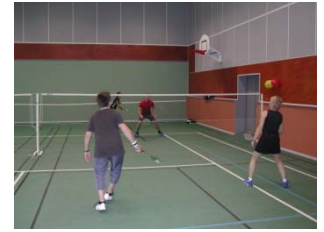
un match tendu !