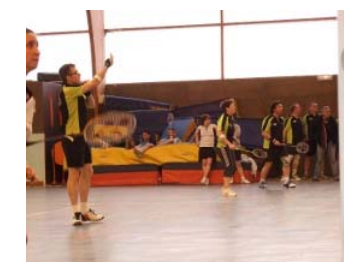
Occupation totale des terrains