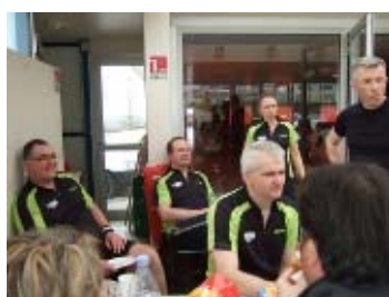
...suivi d'une phase de repos