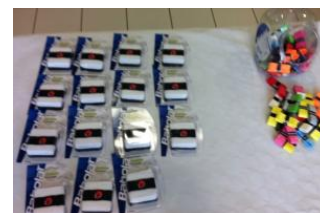
mais tous sont récompensés !