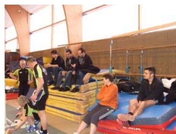
Les supporters du BG