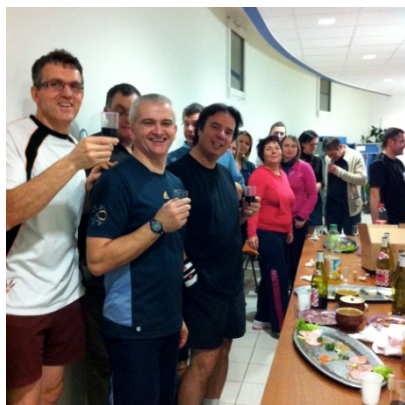
Des joueurs respectueux de la diététique !