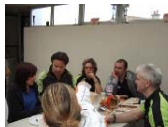
le repas bien mérité...