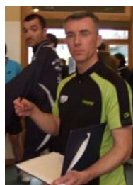
Bon, à table ! pour reprendre des forces