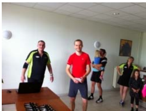
Notre vainqueur ( malgré son T-Shirt ...!!! )