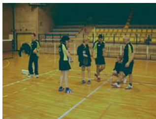
Un peu de stratégie ?!?!