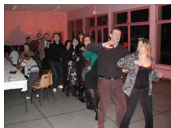
Et c'est parti pour une ambiance de folie qui nous a mené jusque très tard (ou très tôt c'est comme on veut)