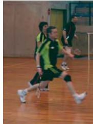
De beaux efforts pour de beaux points...