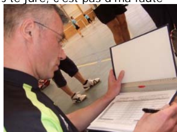
Les feuilles de score sont bien tenues

Prochain rendez-vous le 27 mars à Langres.