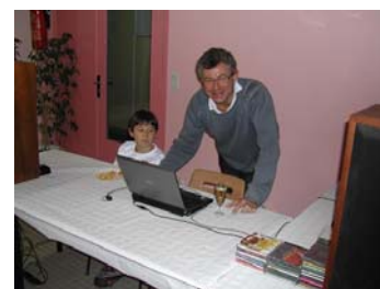
Un animateur High Tech...