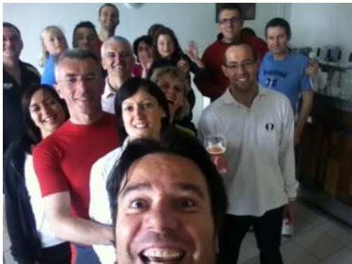
Une partie des joueurs