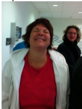
Le tournoi, il est trop tôt pour moi !