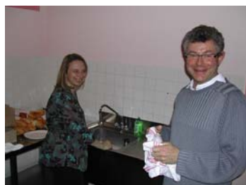
...qui fait aussi la vaisselle