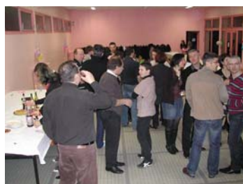
Beaucoup de monde réuni autour des petits fours...