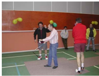
visite de la coordination départementale