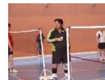
notre coach en pleine réflexion