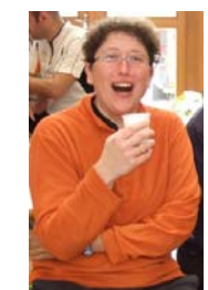
Encore un café ???