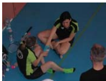
on soigne les bobos